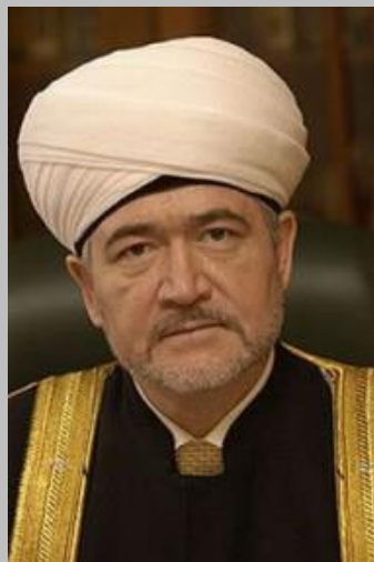
Муфтий шейх Равиль Гайнутдин