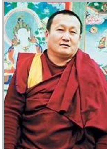
Дамба Бадмаевич Аюшеев

Глава Буддийской традиционной Сангхи России